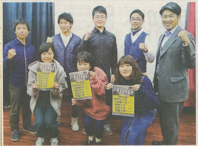
初開催へ意気込む京橋学生映画祭のメンバー＝大阪市都島区